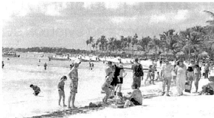
Autoridades deben poner orden en Akumal

Urge tomar cartas en el asunto, pues con la llegada de los paseantes en este periodo vacacional también llegan los riesgos.