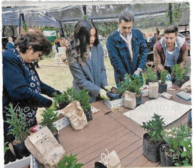
■ Como parte de las actividades del evento, los asistentes elaboraron un mini huerto con la finalidad de crear conciencia medioambiental en ellos.

La cadena continúa a través de las plantas pasteurizadoras, en donde se verifica la composición de la leche y que cumpla con las más estrictas regulaciones. De aquí pasa al envasado, que cierra el ciclo con un envase reciclable.