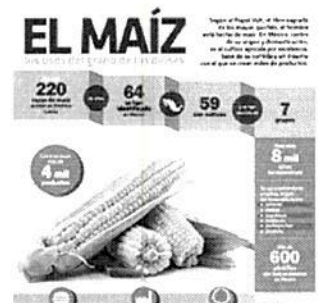
El maíz, el uso del grano de los dioses