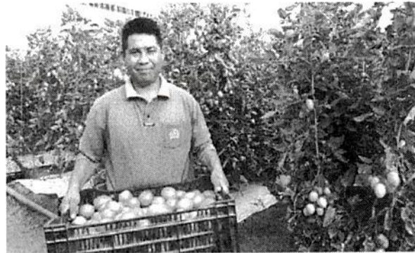
Implementarán apoyos a productores agropecuarios.