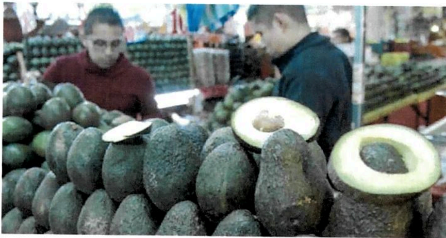
Desde los 30 hasta los 45 pesos, son los precios en los que se encuentra el kilo de aguacate crudo.