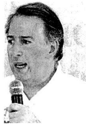
JOSÉ ANTONIO MEADE CANDIDATO PRESIDENCIAL

El exsecretario de Secretaría de Agricultura, Ganadería, Desarrollo Rural, Pesca y Alimentación (Sagarpa), durante el gobierno de Vicente Fox, fue invitado a presenciar y apoyar el mitin político de Pepe Meade en Lagos de Moreno, un municipio al que prometió convertir en pueblo mágico.