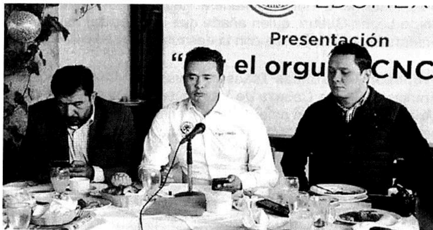
Edgar Castillo Martínez, líder de la Confederación Nacional Campesina.

Asimismo, la rosa es la flor que más se consume en el país, seguida de la gerbera, anturio, liliom, tulipán, crisantemo, gladiola, clavel y los follajes de corte, mientras que en el caso de la gerbera, el SIAP detalló que en 2013 se produjeron alrededor de 980 mil 208 gruesas con un valor estimado de 309 millones de pesos.