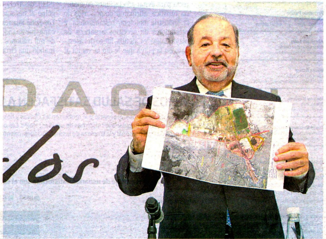
El magnate mexicano pidió analizar cuidadosamente las implicaciones de cancelar.

Enfatizó que suspender el proyecto, es suspender el crecimiento de México. Pág. 20