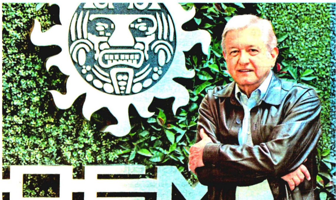
"Soy muy perseverante, soy muy terco, soy muy necio", dice el candidato de Morena, PT y Encuentro Social.

"No acepto que tengamos petróleo y tengamos que comprar gasolina (...) Es como si vendiéramos naranja y compráramos jugo de naranja", ironiza el candidato a la Presidencia de la coalición Juntos Haremos Historia .