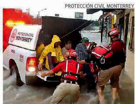
PROTECCIÓN CIVIL MONTERREY

El Departamento de Comercio de Estados Unidos decidió preliminarmente que algún acero estructural proveniente de China y México viola las leyes antidumping del país. Por ello, impuso aranceles de hasta 141 por ciento al acero estructural chino y de hasta 31 por ciento al mexicano. Las autoridades anunciarán su determinación final a más tardar el 24 de enero de 2020. Se han iniciado 182 nuevas indagatorias antidumping en la administración de Trump. Pág. 20