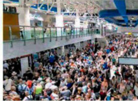
CAPTURA DE PANTALLA

Desde Chile a Madrid, pasando por París o Nueva York, cerca de mil millones de personas pasan el fin de semana confinadas por el coronavirus, que ya ha cobrado un total 12 mil 592 vidas en el mundo. Sin embargo, España e Italia, los dos en cuarentena nacional, no han logrado reducir los niveles de contagio, mucho menos de muertes. Pág. 23