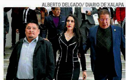
ALBERTO DELGADO / DIARIO DE XALAPA