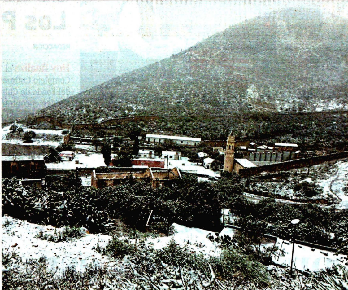
PROTECCIÓN CIVIL SAN LUIS POTOSÍ

Tras 4 años de arresto domiciliario, retiran de la nómina a Marcelo Odebrecht. Pág. 23