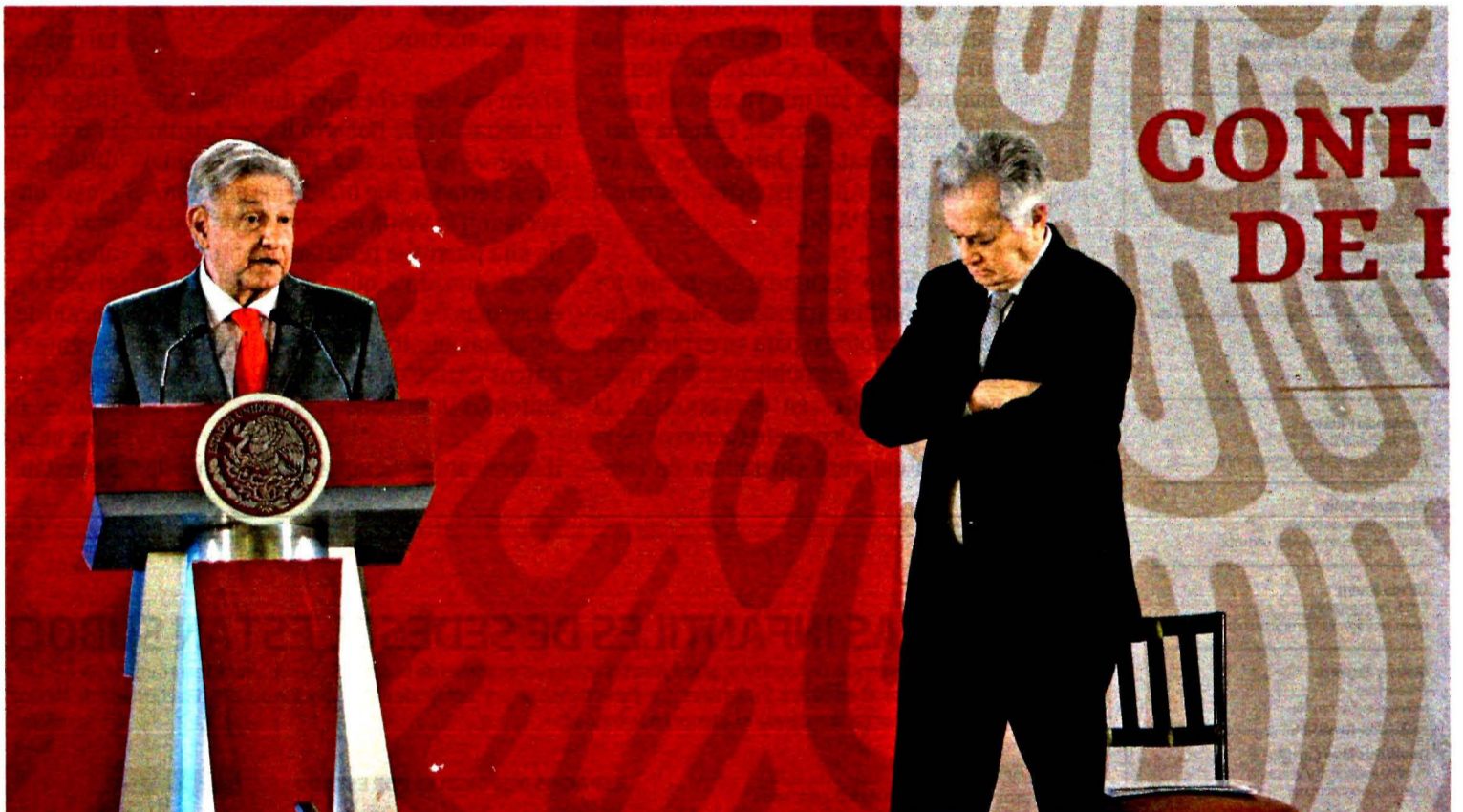
El presidente Andrés Manuel López Obrador con Manuel Bartlett, director de la CFE, ayer en conferencia de prensa