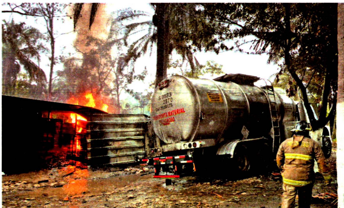
Una bodega de huachicol estalló en Villahermosa, Tabasco, cuando una pipa de 20 mil litros de gasolina descargaba en una vivienda.

Pemex y de la Secretaría de Hacienda viajaron a Nueva York para reunirse con empresas calificadas, fondos institucionales e inversionistas para explicar la importancia de atacar el mercado negro.