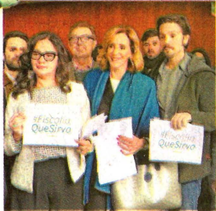
DIEGO LUNA y otros miembros de la sociedad civil protestan por nueva ley