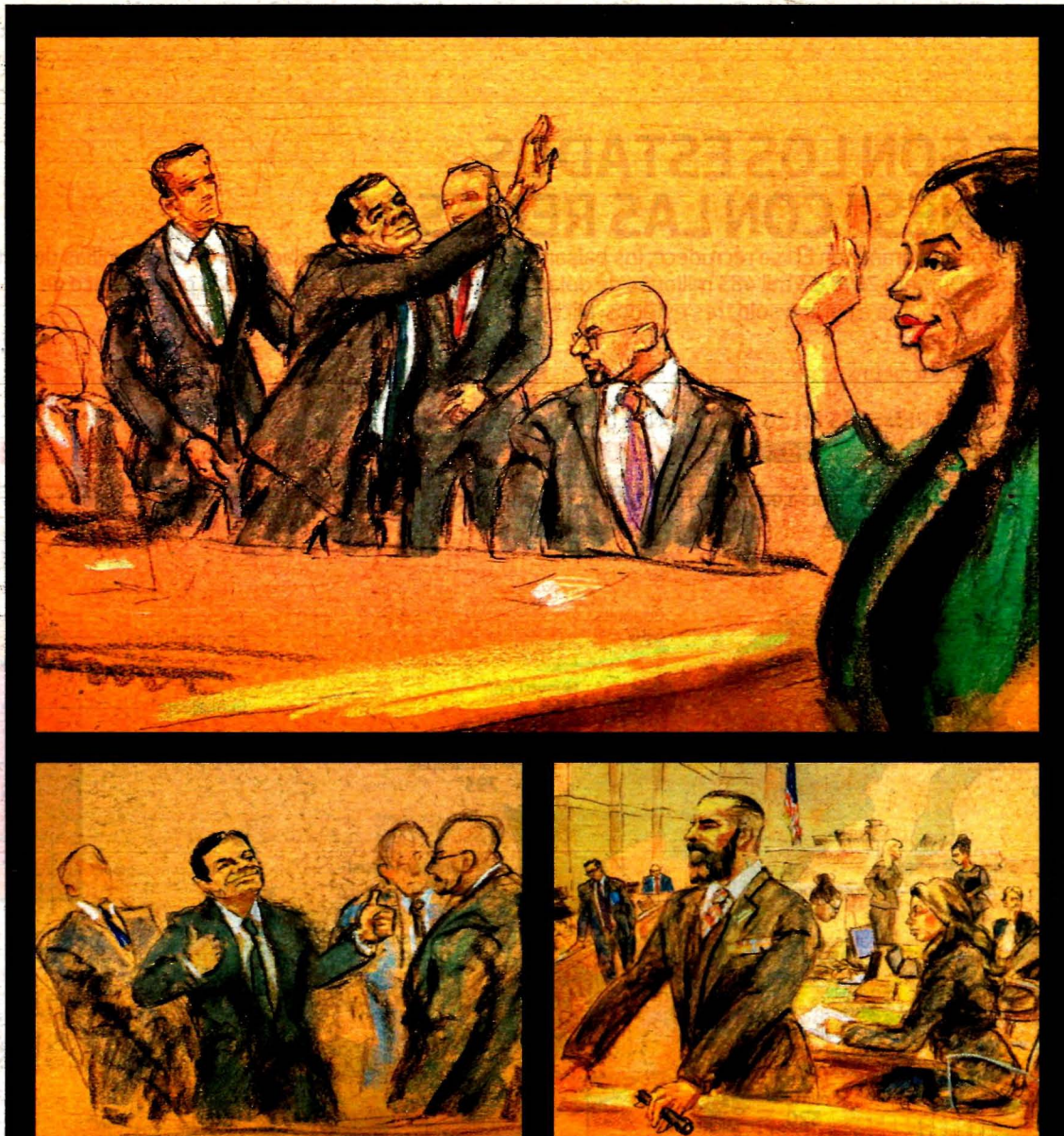
El Chapo, de 61 años y vestido con traje azul y corbata oscura, permaneció impassible.

Las autoridades estadounidenses han guardado silencio respecto al lugar donde será encarcelado Guzmán. Pero desde su extradición en enero de 2017, muchos han esperado que si era hallado culpable fuera enviado a ADX. Pág. 4