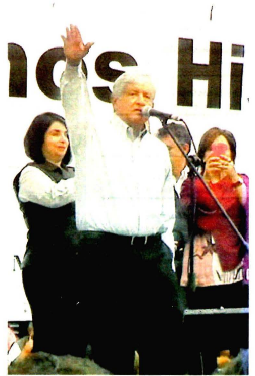
AMLO insistió en que encabeza la preferencia electoral/ CUIHTLÁHUAC RODRÍGUEZ