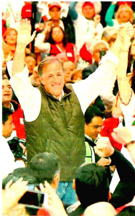
En Edomex, un bastión del PRI, Meade dijo que no fallará/ ROBERTO HERNÁNDEZ