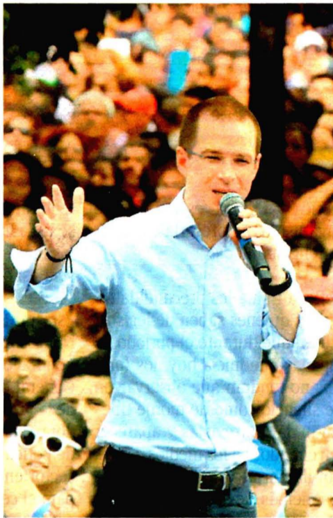
Anaya presumió empate técnico con AMLO y confió en ganar el 1 de julio/ LALO MURILLO