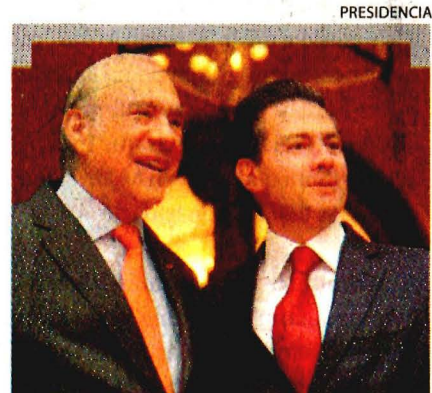
JOSÉ ÁNGEL Gurría y Enrique Peña Nieto