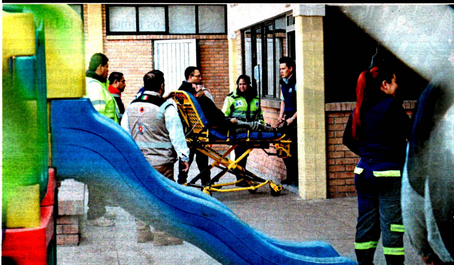
ANTONIO MELÉNDEZ / NOTICIAS DE EL SOL DE LA LAGUNA