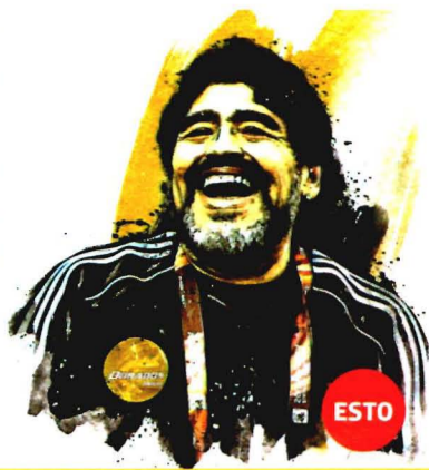
ILUSTRACIÓN: LUIS CALDERÓN

La caza de talento es para Carolina Kropp todo un arte, y ahora se enfrenta a los nuevos requerimientos de la mercadotecnia donde las marcas más prestigiadas buscan a los protagonistas de las redes sociales