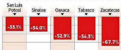
Gráfico: Luis Calderón

Los cinco estados con mayor caída en el valor de la obra privada (Variación % real anual, enero-junio 2019 vs enero-junio 2018)