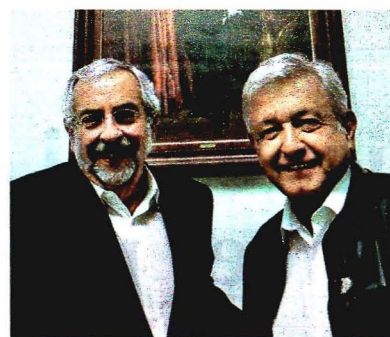
El rector de la UNAM y AMLO

Por su parte, Esteban Moctezuma Barragán, virtual secretario de Educación Pública, aseveró que se lanzará una consulta pública para echar atrás la reforma educativa. Pág 4