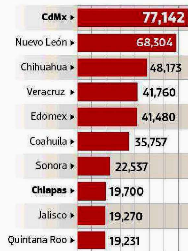
Gráfico: Luis Calderón

Estados con mayor deuda (millones de pesos)