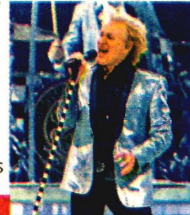
CÉSAR VICUÑA / OCESA