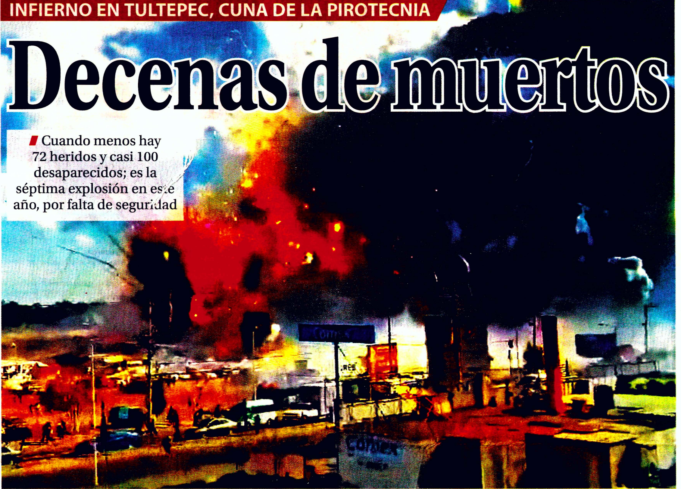
POR GERARDO CAMPOS, MIGUEL ÁNGEL BRAVO Y EL SOL DE TOLUCA

■ Cuando menos hay 72 heridos y casi 100 desaparecidos; es la séptima explosión en este año, por falta de seguridad