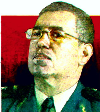
ILUSTRACIÓN: ABRAHAM SOLÍS

El general de brigada del Estado Mayor Presidencial, Luis Rodríguez Bucio, es el responsable de la seguridad nacional. Su trayectoria es reconocida por tareas de inteligencia y operaciones contra el narco en Tamaulipas y Sinaloa. Estudió un doctorado en Defensa y Seguridad Nacional en el Centro de Estudios Superiores Navales. Pág. 4