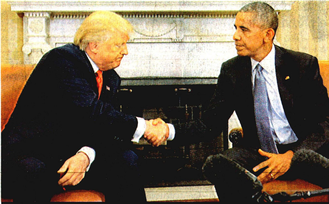
AÚN CON visibles diferencias, el presidente Barack Obama recibió en la Casa Blanca a su sucesor Donald Trump, en un intento por limar asperezas, para arrancar el proceso hacia el nuevo Gobierno.

El exgobernador de Sonora anunció que comparecería para demostrar su inocencia; quedó en el Reclusorio Oriente