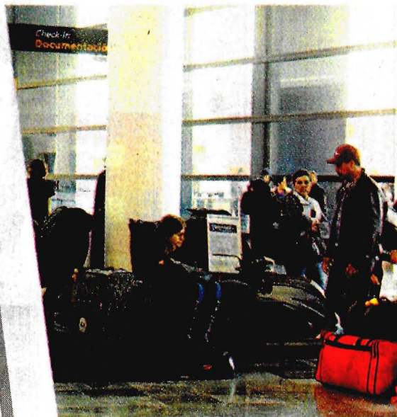
EL INCREMENTO en los servicios por transporte aéreo presiona a la inflación.