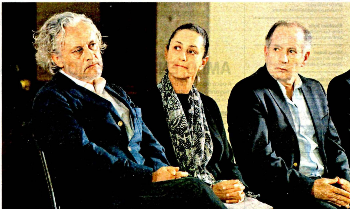
El artista plástico Gabriel Orozco estará a cargo de todo el proyecto.

Ya no volverá a ocurrir que se pierda alguno de los juicios, respondió cuando se le cuestionó por la estrategia legal del gobierno a su cargo para impedir la privatiza-