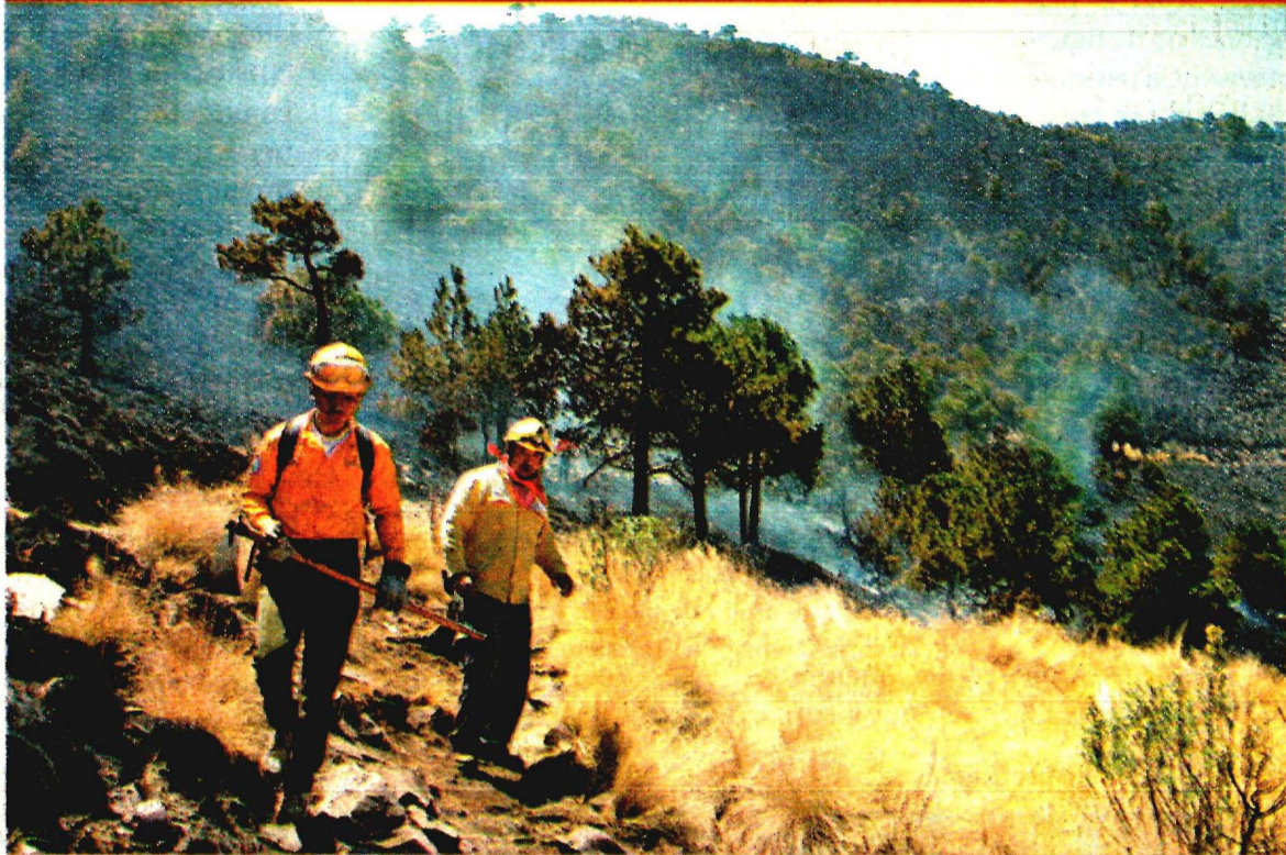
EL INCENDIO en la zona conocida como Pico del Águila, en el Ajusco, fue controlado por bomberos y cuadrillas de Protección Civil luego de 20 horas, tras haber consumido pastizales y hojarascas. Aún se desconoce el origen del siniestro. En lo que va de este año, suman 364 conflagraciones forestales en la Ciudad de México, mientras que en todo 2016 se registraron 966.