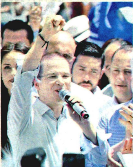
Ricardo Anaya revivirá las conferencias mañaneras por las que es conocido Andrés Manuel López Obrador. Dijo que es prioritario garantizar la paz