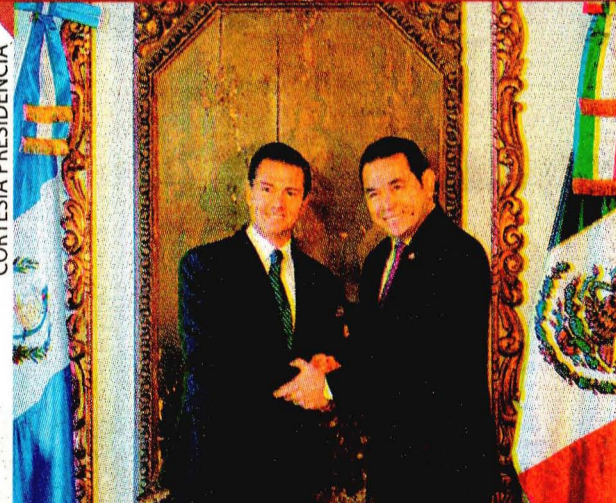
PARA REALIZAR una visita de Estado, el presidente Peña Nieto viajó a Guatemala y por la noche cenó con su homólogo Jimmy Morales