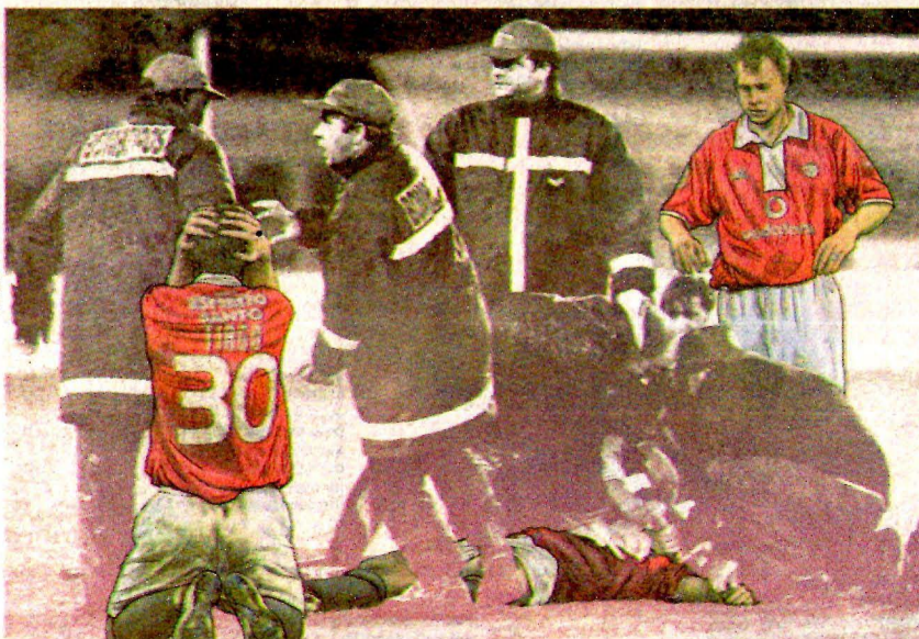
ILUSTRACIÓN: VICTOR NIETO

Son escenas que parecen de ciencia ficción: jugadores de alto rendimiento que caen muertos en la cancha. Esta es la historia de 11