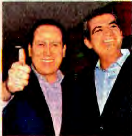
ERUVIEL ÁVILA y el líder nacional del PRI, Enrique Ochoa Reza