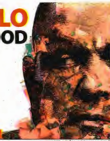
ILUSTRACIÓN: ABRAHAM SOLÍS