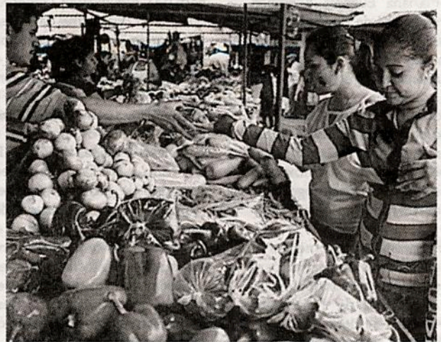
Moderados aumentos de precios de los alimentos.

Finalmente, en el mercado Felipe Ángeles de Guadalajara, en Jalisco, el precio del aguacate descendió 8.0 pesos y se ofreció en 30 pesos en comparación con la semana pasada, mientras que el limón, la cebolla, el huevo, el jitomate y el endulzante se vendieron en 15, 10, 35, 10 y 18 pesos cada uno.