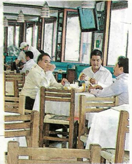
Uno de los primeros daños colaterales de la ofensiva comercial de EU