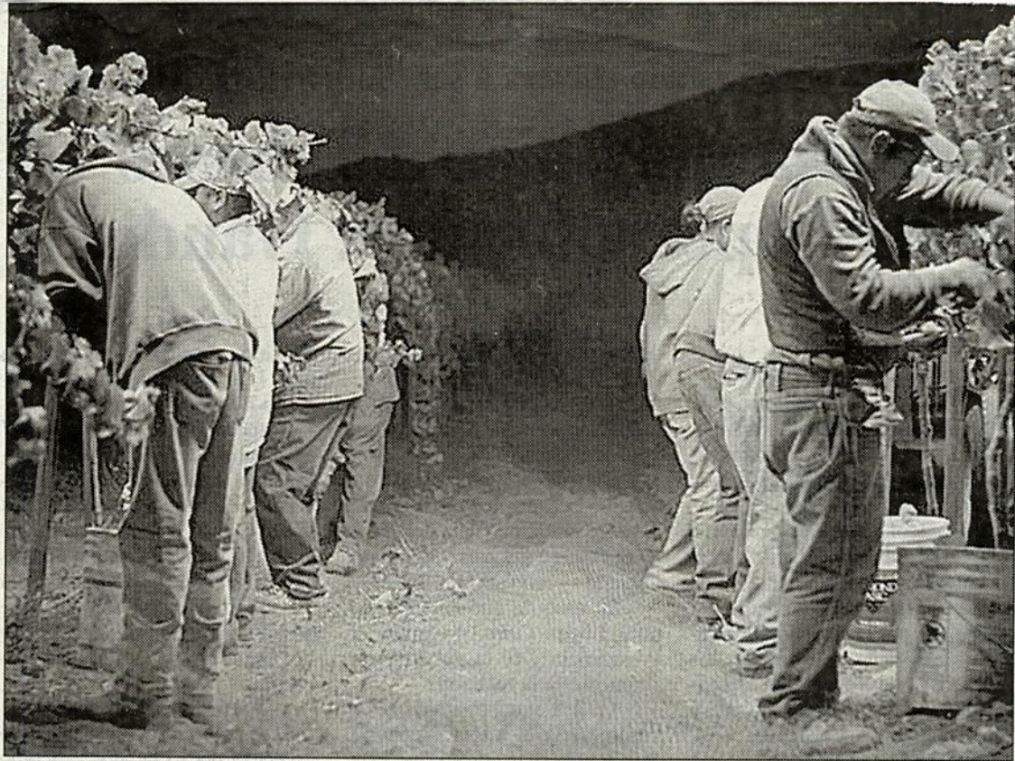
Para hacer frente al desabasto de agua, el gobierno de Baja California, en asociación con una empresa israelí, construirá un acueducto de 100 kilómetros para llevar aguas tratadas de Tijuana a Ensenada, con la finalidad de regar los viñedos del Valle de Guadalupe y además ampliar el área de riego para la producción de vinos

gobierno estatal, que la venderá a los agricultores a un precio estimado de 11 pesos el metro cúbico. Para ello, el gobierno estatal creará un fideicomiso.