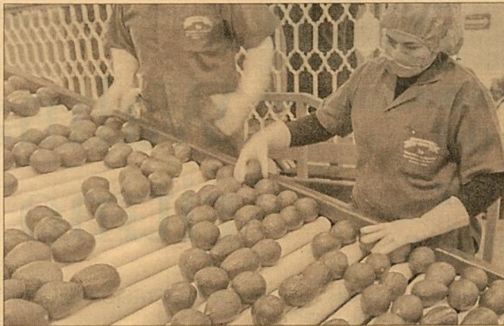
EU: DEPENDENCIA EXTERNA EN FRUTAS Y HORTALIZAS, 2016