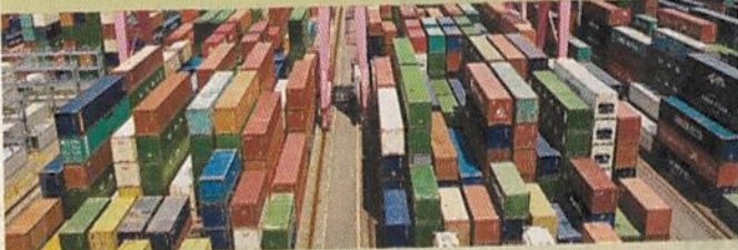
EXPORTACIONES MÉXICO- EU, POR CATEGORÍA (Millones de dólares, variación porcentual anual, primer trimestre de 2018)

Con todo y la presión que EU ha hecho al País para frenar el comercio, las exportaciones crecieron en el primer trimestre.