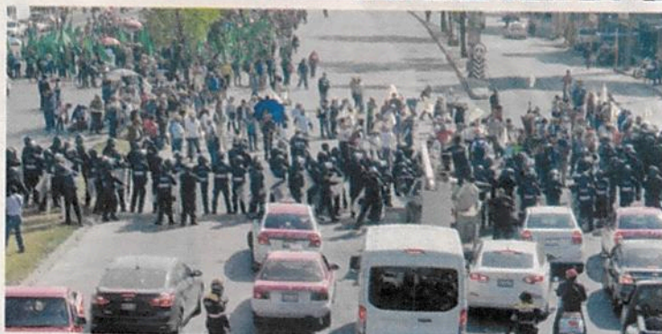
Protesta. Tres contingentes con cerca de 1,500 campesinos marcharon de la Segob hacia el aeropuerto capitalino para exigir al gobierno el pago de las tierras que, acusan, les fueron expropiadas para construir el Nuevo Aeropuerto de la Ciudad de México.