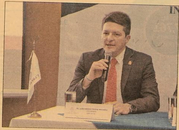
Porras Brambila indicó que la ventaja de Jalisco es contar con prácticamente todos los sectores económicos.

A su regreso de Washington, donde de la semana pasada continuaron las negociaciones entre representantes de Estados Unidos, México y Canadá, el industrial jalisciense dijo a El Econo-