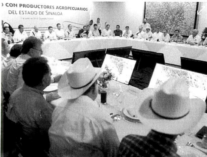
Reunión de productores con autoridades federales y estatales.