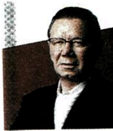
Razones JORGE FERNÁNDEZ MENÉNDEZ www.excelsior.com.mx/jfernandez www.mexicoconfidencial.com