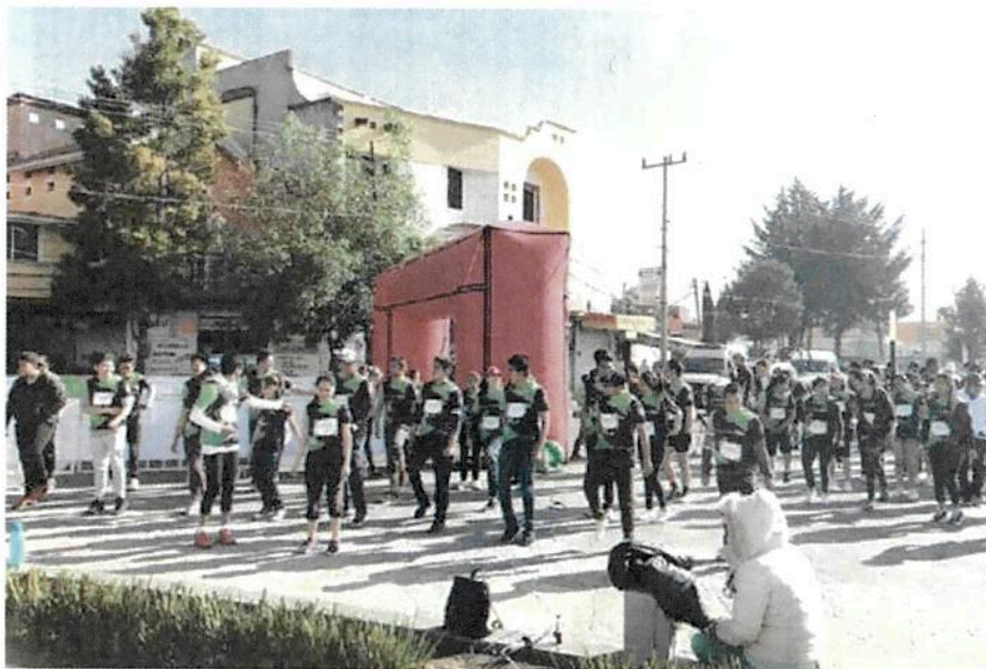
Con más de 500 participantes, se llevó a cabo la carrera 5k SAGARPA Arráigate Mx.