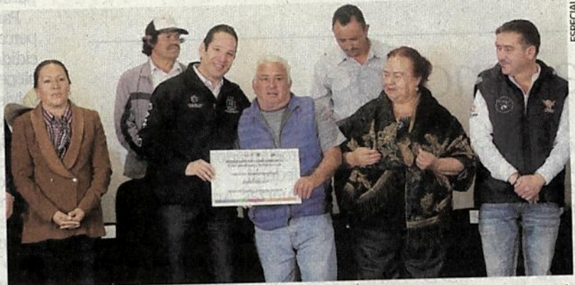
En la entrega de la ayuda, el gobernador Francisco Domínguez Servién indicó que hasta noviembre del año pasado se tenía una bolsa de 201.6 mdp.