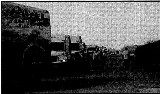
MATAMOROS, Tamps.- Bloqueo por casi 24 horas.

La carretera Matamoros-Victoria cumplió 24 horas cerrada a la circulación por los pescadores del poblado Higuerillas e Islas circunvecinas.