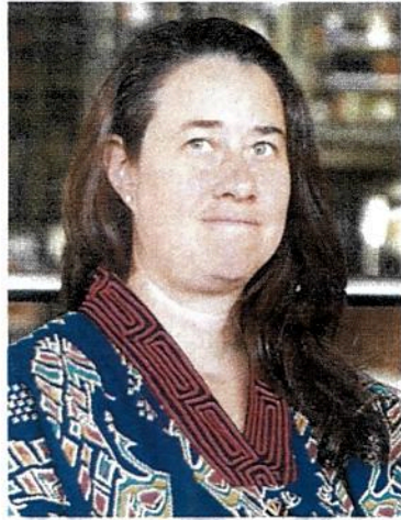
Rivero | Felices de llegar a diez años.

Indica que estar vigentes es un reto ya que no es nada fácil año con año buscar los recursos económicos. En este sentido señala que