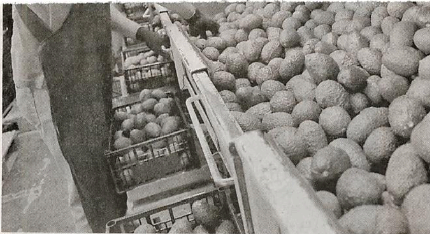
EL AGUACATE jalisciense tiene la certificación ambiental de Rainforest Alliance, lo que le permitirá un mayor dinamismo económico

mentaria a la otorgada por el Servicio Nacional de Sanidad, Inocuidad y Calidad Alimentaria (Senasica) y precisó que si en 2012 se producían en Jalisco 40 mil 485 toneladas de aguacate. Notimex