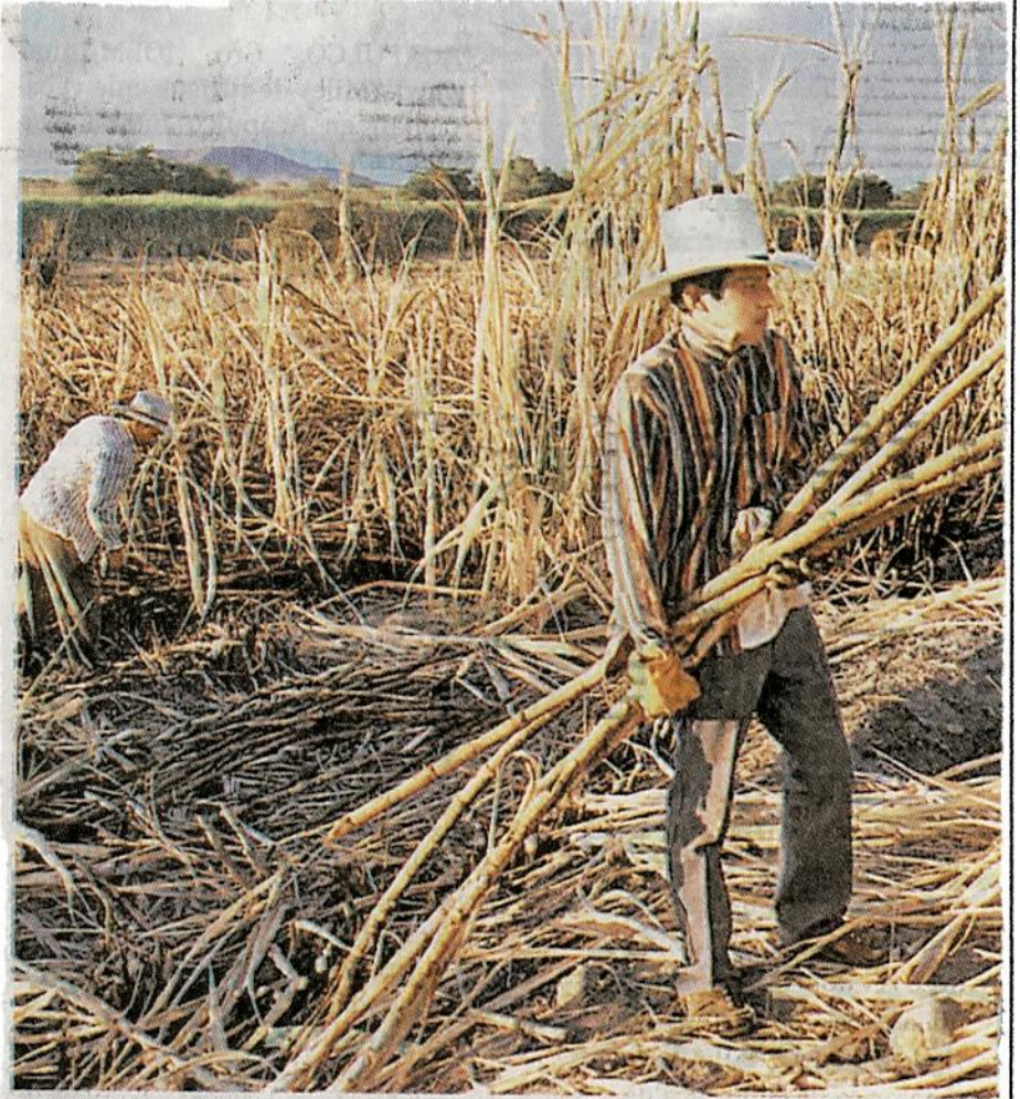
CORTADORES GANAN de 192 a 228 pesos por día

Pese a las dificultades dice que jamás ha pensado en dejar el campo: "No, nunca, jamás —espeta con tono ofendido— hay que conservar lo que dejaron los viejos... de esto hemos vivido siempre, no queda más que aguantar", dice mientras su mirada parece ir más allá del cañal, de las parcelas vecinas, hacia el cielo que se extiende en el horizonte.