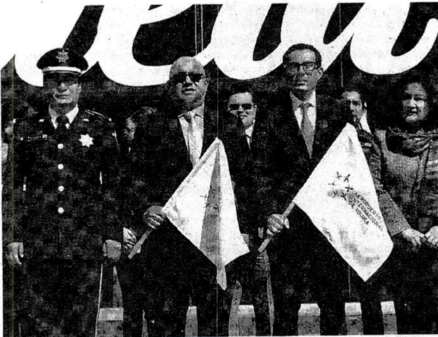
El operativo decembrino en el aeropuerto de Toluca concluirá hasta el 8 de enero.