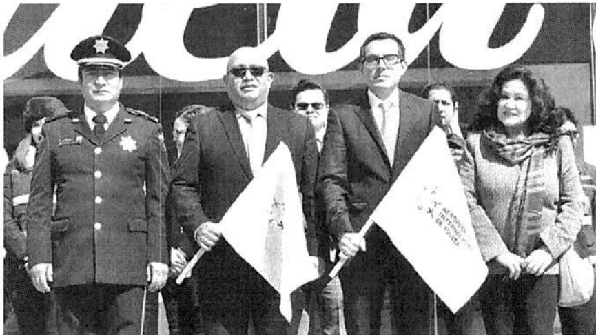
Aeropuerto Internacional de Toluca, pone en marcha el operativo "Vacaciones de invierno 2017".