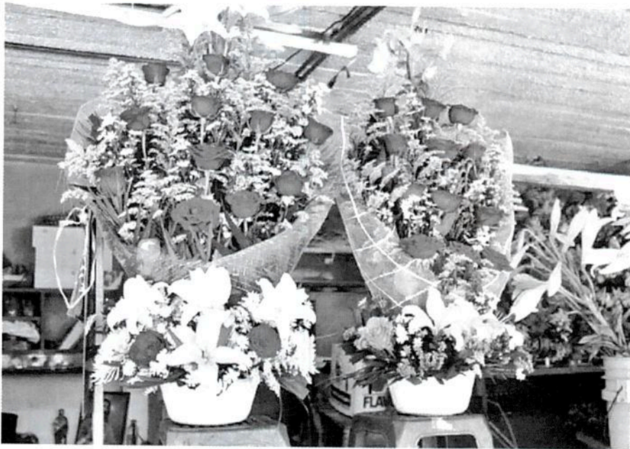
Vendedores de flores se preparan para ventas por día de la madre.