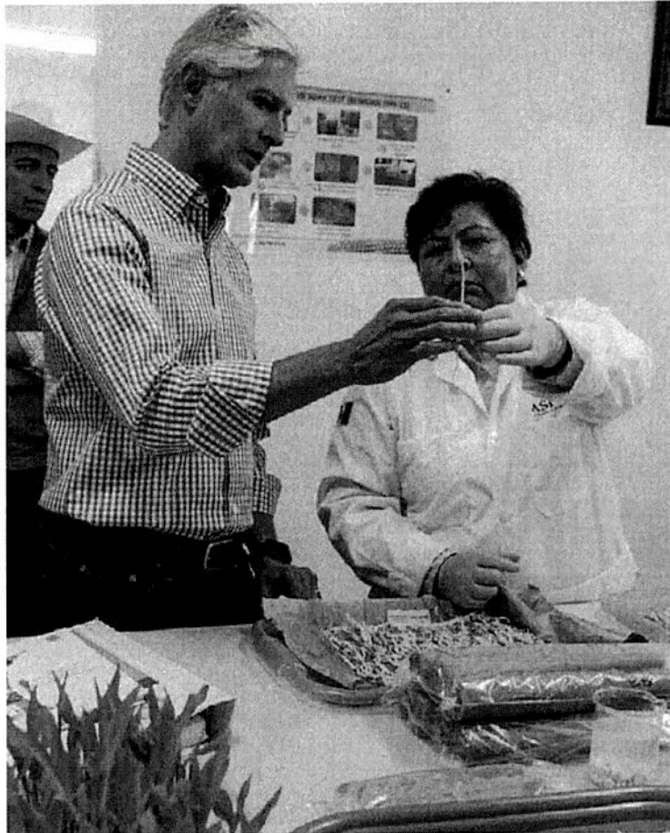
El mandatario recorrió las instalaciones de Aspros.